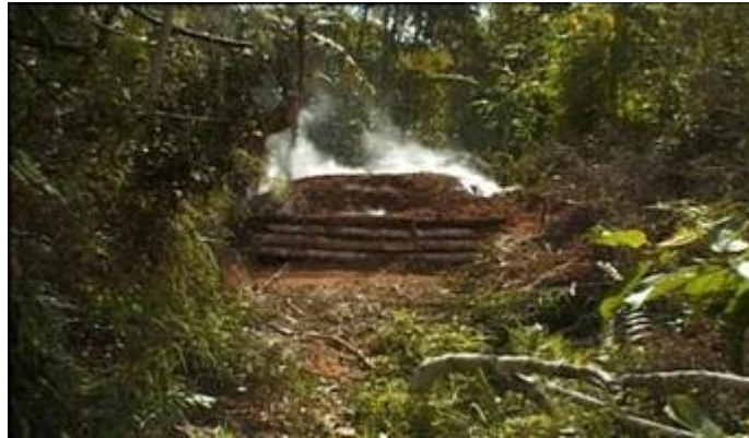
four à charbon de bois près des coupes dans la forêt

Les villageois d'Ampasimpotsy vivent du travail de la terre par la culture du riz dans les "tavy", ainsi que en rizière irriguée dans le fond de la vallée. Ils travaillent aussi la moitié du temps à faire du charbon de bois. Ils coupent les arbres de la forêt et les consomment dans des petits fours provisoires aux bords des chemins. Donc des deux côtés, c'est la forêt qui est attaquée.