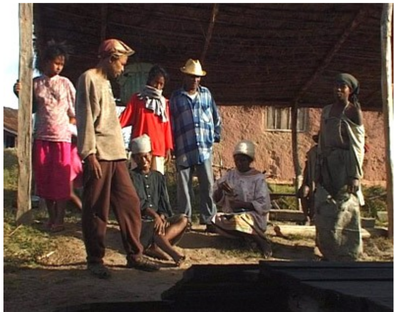
paye de 2 villageois qui ont livrés leur feuilles de Rhus Tarentana à la distillerie